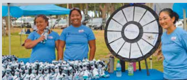
「UnitedHealthcare Community Plan」的工作人員在各島支援「出生缺陷基金會」的活動，至今透過健走籌款近 6,000 美元，並在繼續籌募善款。