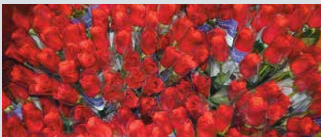
「夏威夷 UnitedHealthcare Community Plan」在母親節這一天，在「歐胡島新希望教會」的教堂分發近 400 枝長枝玫瑰。