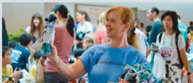
2 月 14 日，在 2015 年兒童大阿羅哈跑步活動中，12 歲及以下兒童參加圍繞 Neal S. Blaisdell 中心的 2 英里跑步。UnitedHealthcare 是該活動的贊助商之一。