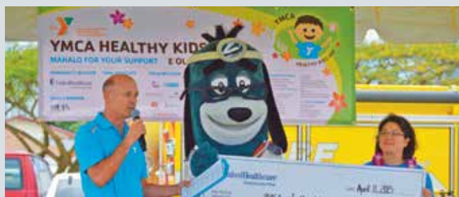
4 月 11 日，作為「歐胡島 YMCA 兒童健康日」活動的主要冠名贊助商，「UnitedHealthcare Community Plan」將 10,000 美元的支票交給 YMCA。