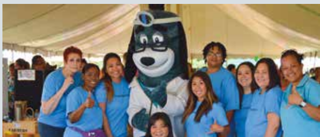
5 月 10 日，本計劃的現場服務協調員在美麗的 Wai'anae 海岸參加第 10 屆年度 Wai'anae 兒童之春活動。