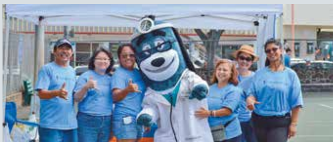
3 月 28 日在 Kaimuki 區公園年度聖誕節彩蛋尋寶活動中，義工和 Health E. Hound 醫生向孩子們分發特製的糖果。