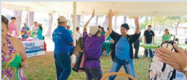
5 月 9 日，UnitedHealthcare 的工作人員以義工身份參加第 23 屆年度菲律賓節，與到場的老幼一起鍛煉身體。