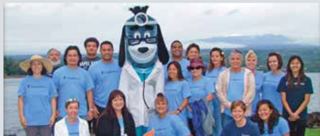
3 月 7 日，大島東夏威夷分部的工作人員以義工身份參加第 18 屆年度希羅保護心臟防中風健走活動。